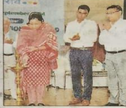
पर्यावरण उत्सव के समापन समारोह का उद्घाटन करती डीसी। साथ में नगर आयुक्त व अन्य। मॉडल प्रस्तुत करती छात्राएं।